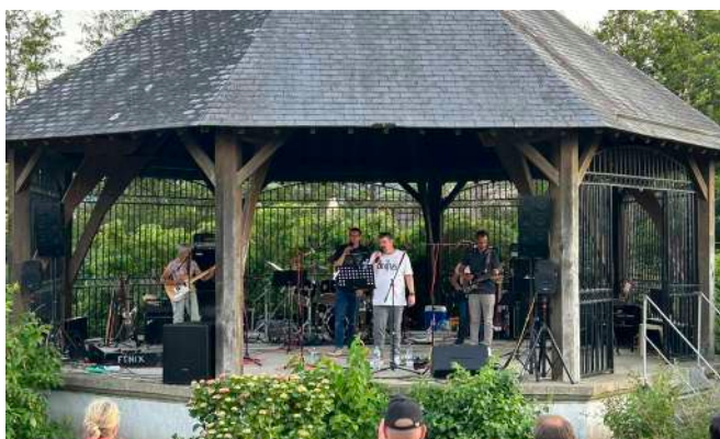
Atelier de musiques actuelles Ad Lib Fête de la Musique