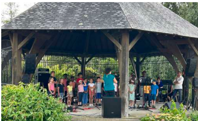
Chorale des enfants Fête de la Musique