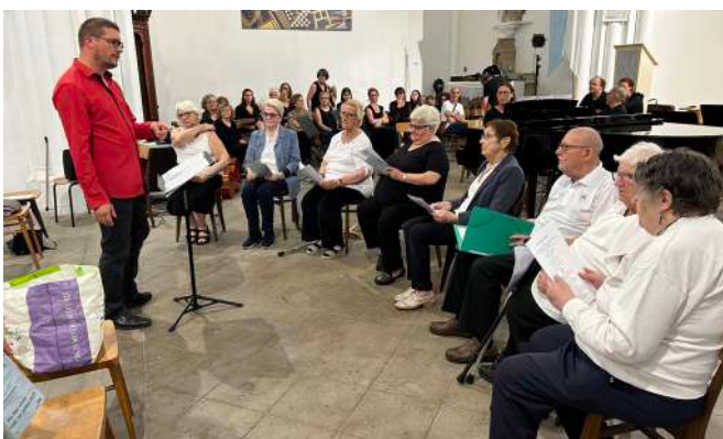
Chorale des résidents de la Roseraie 20 juin 2023