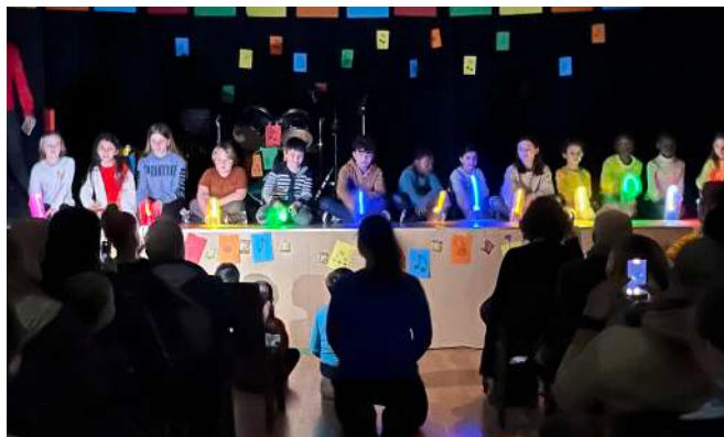
Concert Ça percute 28 mars 2023