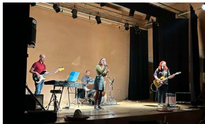
Atelier de musiques actuelles 11 mai 2023