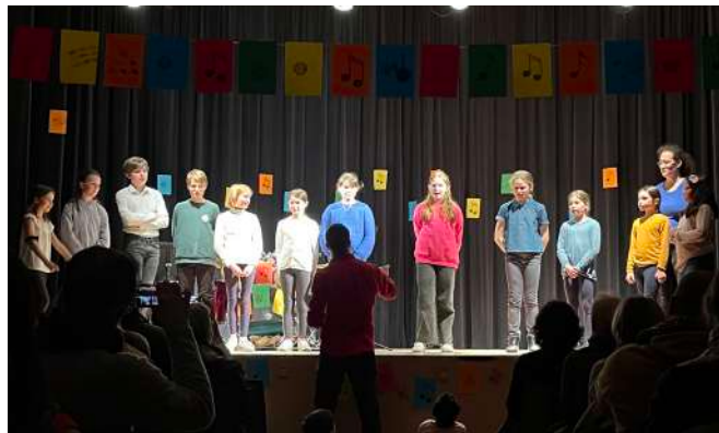
Concert Ça percute 28 mars 2023