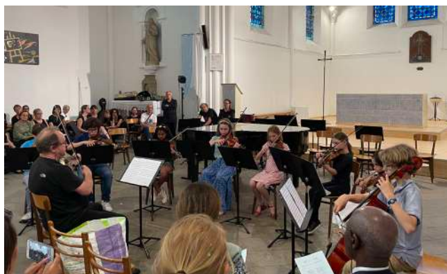
Orchestre à cordes du 1 er cycle 20 juin 2023