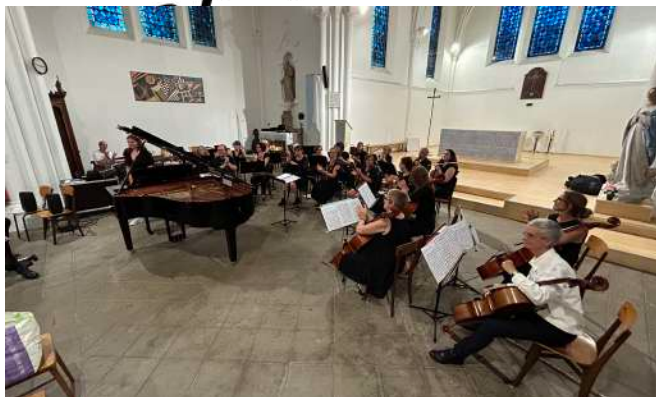
Ensemble instrumental Amati et Orchestre à cordes du 2 nd cycle