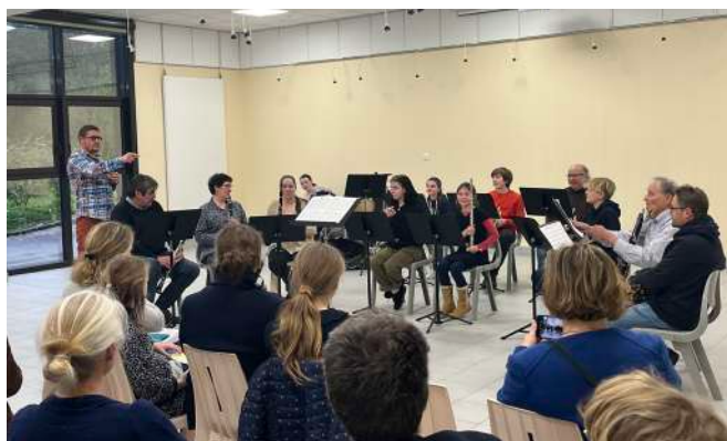
Audition instrumentale 11 avril 2023