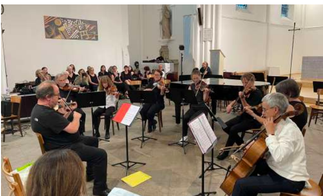
Atelier de musiques traditionnelles 20 juin 2023