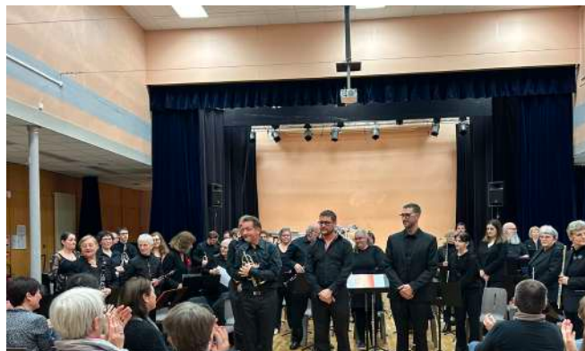
Orchestres d'harmonies Notre-Dame de Bondeville et le Houllme