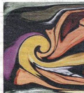
Une œuvre de Philippe Hélie

que, qui, conjuguée à sa sensibilité artistique, lui a permis de créer des univers souvent poétiques, parfois fantastiques, mais qui toujours savent interpeller les amateurs de belles images et ouvrent la porte de leur imaginaire. Martine Giloppé expose depuis maintenant plusieurs années dans des salons régionaux et surprend par des techniques et approches sans cesse renouvelées.