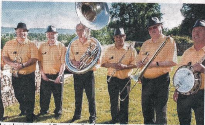
Le « Louisiana and Caux Jazz Band » se produira vendredi 17 octobre à 20 h 30 salle André-Gide

■ Tarifs : pour une soirée, repas compris, tarif normal 25 € et tarif réduit 20 €. Pour deux soirées, repas compris, tarif normal 45 € et tarif réduit 35 €. Les réservations sont prises dès maintenant au 06 06 88 75 83 ou par courriel asso.cailly.jazz@gmail.com