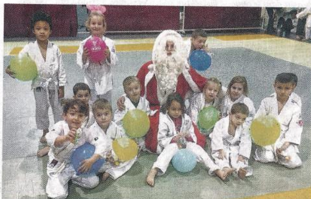
Les plus jeunes, de l'éveil judo, ont joué avec des ballons de baudruche

■ Pour tout renseignement : 02 35 76 39 36 ou contacts@msajudo-jcb.com