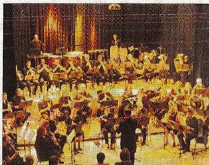
L'orchestre sera composé d'une soixantaine de musiciens