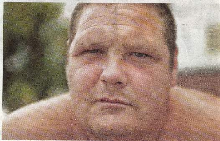
« La BM du Seigneur », long métrage de 2010