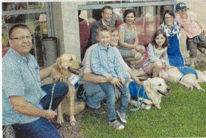
Elus et personnel des établissements ont accueilli Jasper, Ivanoé et Indigo