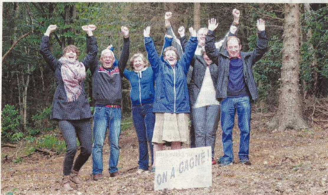
Après six mois d'incertitude et de mobilisation, les riverains vont célébrer ce samedi leur victoire