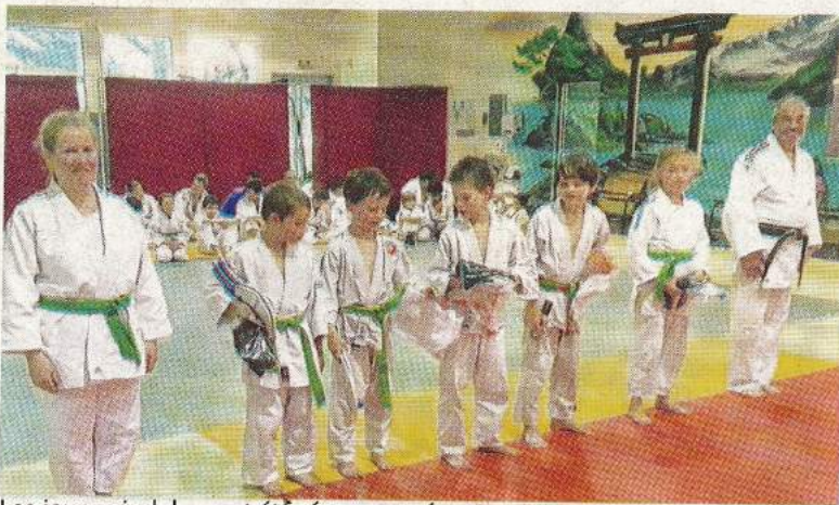
Les jeunes judokas ont été récompensés