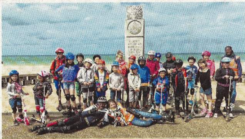
Les enfants sont allés à Dieppe et ont profité des joies du bord de mer

Ainsi les enfants sont allés à Woupi, au laser games, au bowling, au cinéma. Ils ont découvert des activités en extérieur comme l'accrobranche ou encore le poney, se sont rendus à Dieppe pour une balade et ont passé une journée au parc du Bocasse. « Des mini-séjours en camping sont également proposés chaque semaine aux enfants du centre », précise le directeur, les deuxième et quatrième semaines sont réservées au groupe