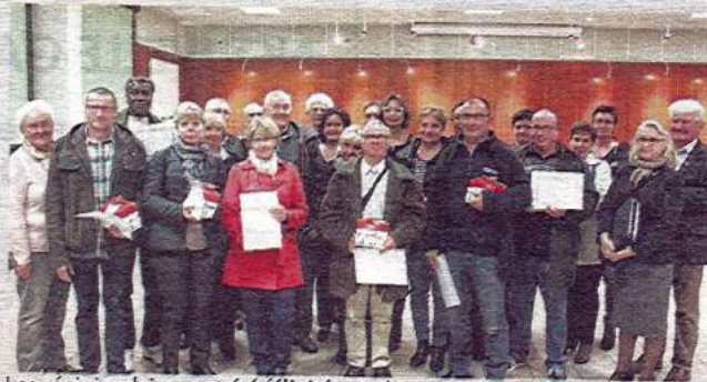
Les récipiendaires ont été félicités et récompensés