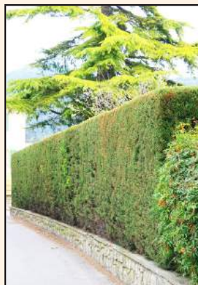
Haie respectant la législation

Bien que l'équipe des services municipaux se charge du mieux possible de beaucoup de ces tâches, cela ne dispense en rien les Bondevillais de leurs obligations.