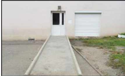
Création d'une rampe PMR