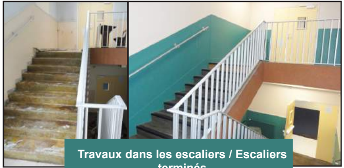
Travaux dans les escaliers / Escaliers terminés