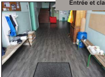
Entrée et classes terminées