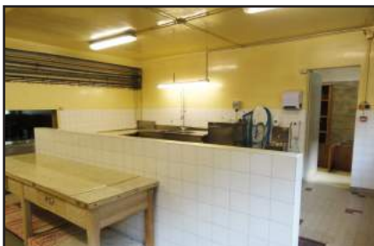
Cuisine avant travaux ( plonge et distribution dans la même pièce )