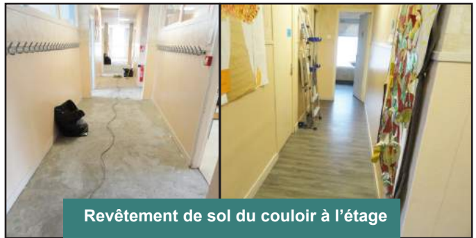
Revêtement de sol du couloir à l'étage