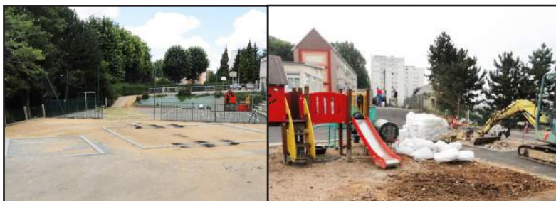
Reprise de la cour maternelle