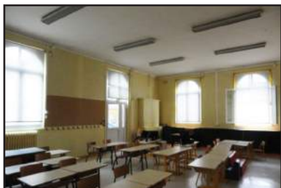
Classes avant travaux

Alors tous ensemble, prenons le temps d'apprécier ces quelques pages et de constater que malgré le contexte nous luttons pour vivre mieux à Notre-Dame de Bondeville, ensemble.