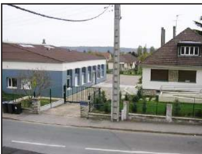
Les Moussaillons et les Globe-Trotteurs

En 2010, ces trois établissements sont regroupés administrativement au sein d'un IME (institut Médico-éducatif), l'Escale.