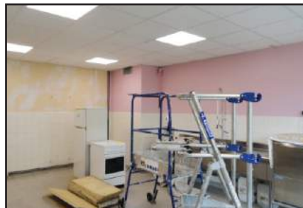
Rénovation du local plonge