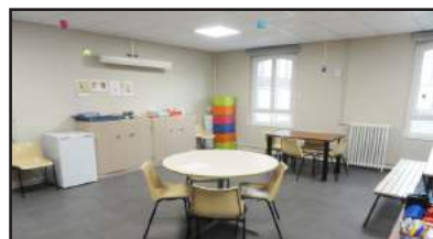
Rénovation de la Halte Garderie