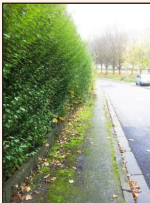
Haies débordantes, trottoir non démaussé, en infraction avec la législation.